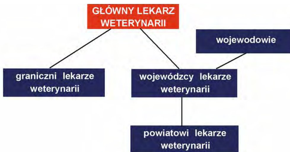
Rys. 2. Schemat organizacji Inspekcji Weterynaryjnej w Rzeczypospolitej Polskiej

Struktura oraz kompetencje organów Inspekcji Weterynaryjnej zostały określone w ustawie z dnia 29 stycznia 2004 r. o Inspekcji Weterynaryjnej (Dz. U. z 2007 r. Nr 121, poz. 842, z późn. zm.).